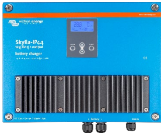
Skylla-IP44 12/60 (1+1)

12 V/60 A and 24 V/30 A, intervall ingångsspänning 90-265 V