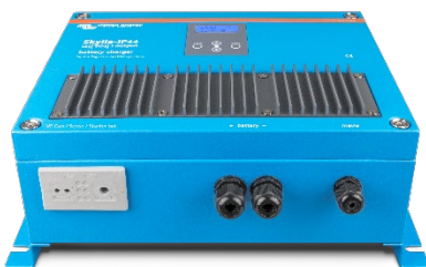
Skylla-IP44 12/60 (1+1)

För att lära dig mer om batterier och laddning av batterier, se vår bok 'Fristående elkraft' (tillgänglig gratis från Victron Energy och nedladdningsbar från www.victronenergy.com ).