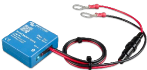
Bluetooth-avkänning Smart Battery Sense