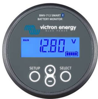
Bluetooth-avkänning BMV-712 Smart Battery Monitor