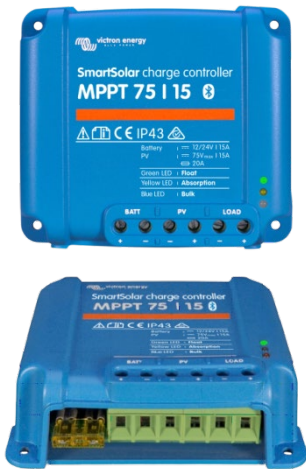
SmartSolar laddningsregulator MPPT 75/15